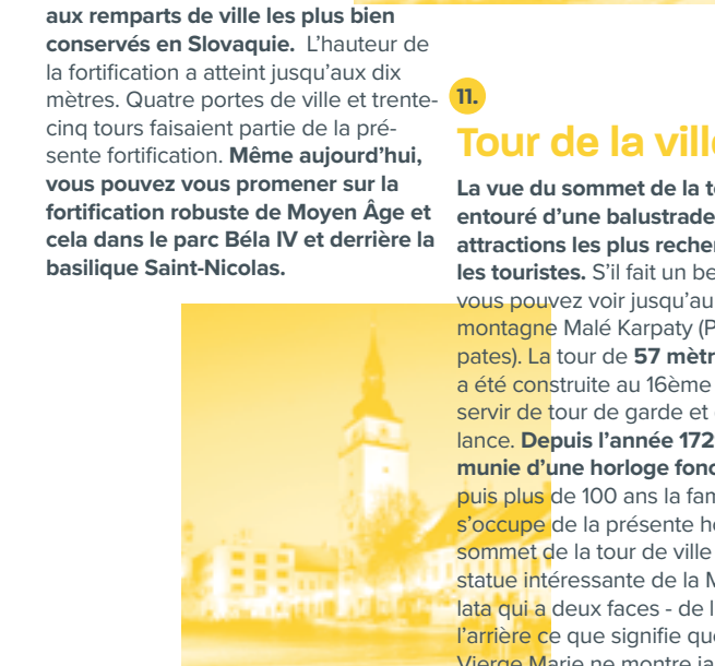
Nádvorie (La cour)