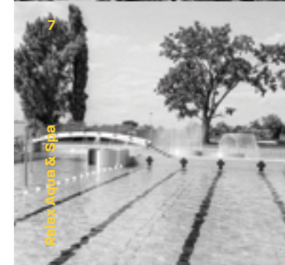
Relax Aqua & Spa