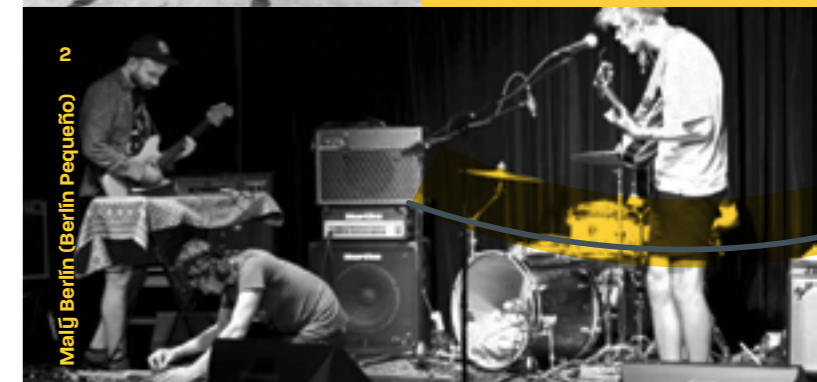
Malý Berlín (Berlín Pequeño)