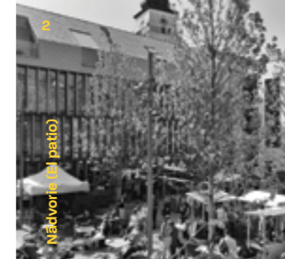
Nádvorie (El patio)

Los edificios majestuosos que servían a la famosa Universidad de Trnava son las pruebas magníficas de la época inolvidable. Se trata de las facultades en los alrededores de La catedral de San Juan el Bautista y también los seminarios e internado aristocrático en la calle adyacente. Todos los edificios: Adalbertinum, Rubrorum, Marianum, Stephaneum o el mencionado internado aristocrático merecen la pena verlos.